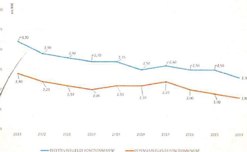
Evolution recettes et dépenses réelles fonctionnement