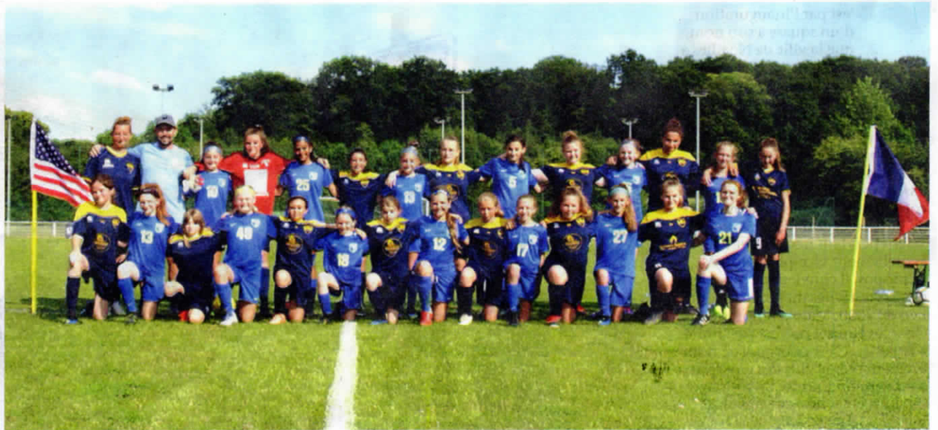
Noailles foot féminin

Après la compétition, les filles ont toutes été récompensées, comme c'est la coutume à Noailles, par une jolie coupe. L'après-midi, c'était au tour du match France - Etats-Unis, puisque l'équipe de Lionville Soccer, proche de Philadelphie, en villégiature en France, était présente. L'occasion de se mesurer à un groupe venant d'un pays qui reste encore aujourd'hui la plus grande référence de football féminin dans le Monde. La qualification de la sélection américaine