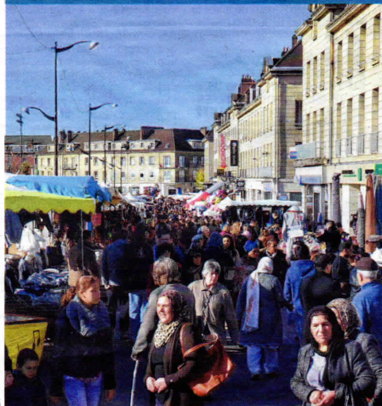
Avec une croissance de près de 6 % en cinq ans, Creil continue de grandir.